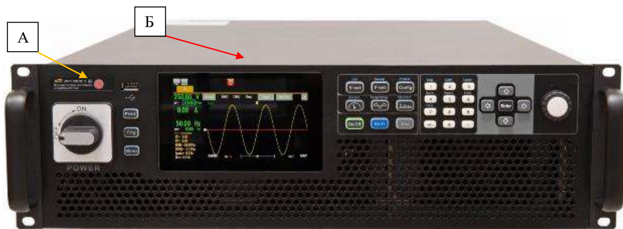
Рисунок 1 – Общий вид модификаций источников с местами нанесения знака утверждения типа (А) и нанесения знака поверки (Б)

Для предотвращения несанкционированного доступа к внутренним частям источников пломбируются крепежные винты на задней стороне корпуса. Пломба может устанавливаться производителем, ремонтной организацией, поверяющей организацией или организацией, эксплуатирующей данное средство измерений, в виде наклейки, мастичной или сургучной печати.